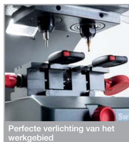
Perfekte verlichting van het werkgebied