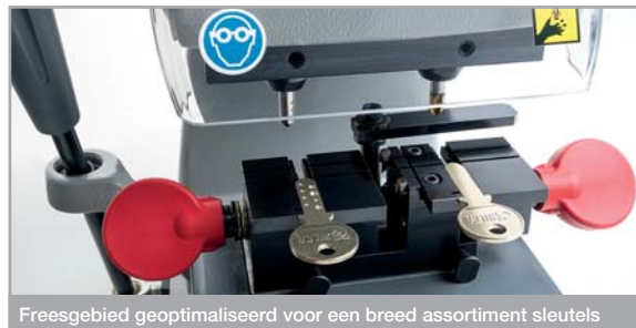
Freesgebied geoptimaliseerd voor een breed assortiment sleutels

De hendels en knoppen van de machine zijn gemaakt van technische kunststoffen en