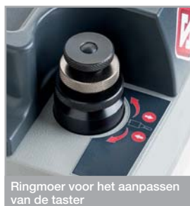
Ringmoer voor het aanpassen van de taster