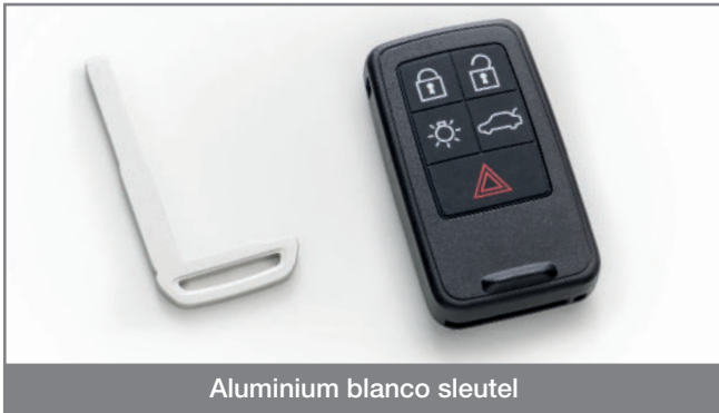
Aluminium blanco sleutel

Silca presenteert met trots een nieuwe referentie voor het dupliceren van Volvo® slot sleutels: de perfecte oplossing voor het vervangen van beschadigde of verloren geraakte sleutels of kunnen gewoonweg dienen als reserve in geval van nood.